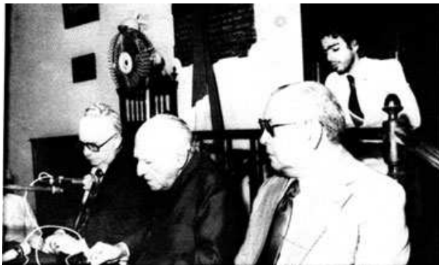
Gilberto Freyre, ao pronunciar sua conferência, por ocasião da Semana de Estudos Afro-Brasileiros, promovidos pelo IGHA.

histórico-econômico como histórico-social de uma das mais importantes regiões não apenas brasileira como lusotropicalis: a Amazônia. 17